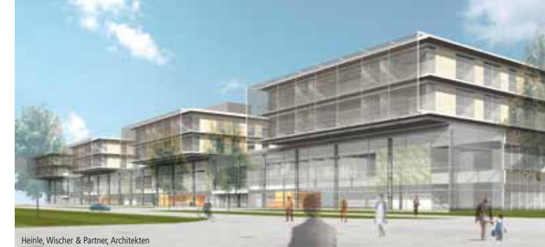
Heinle, Wischer & Partner, Architekten